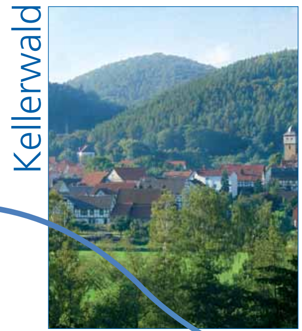
Leben am Bach